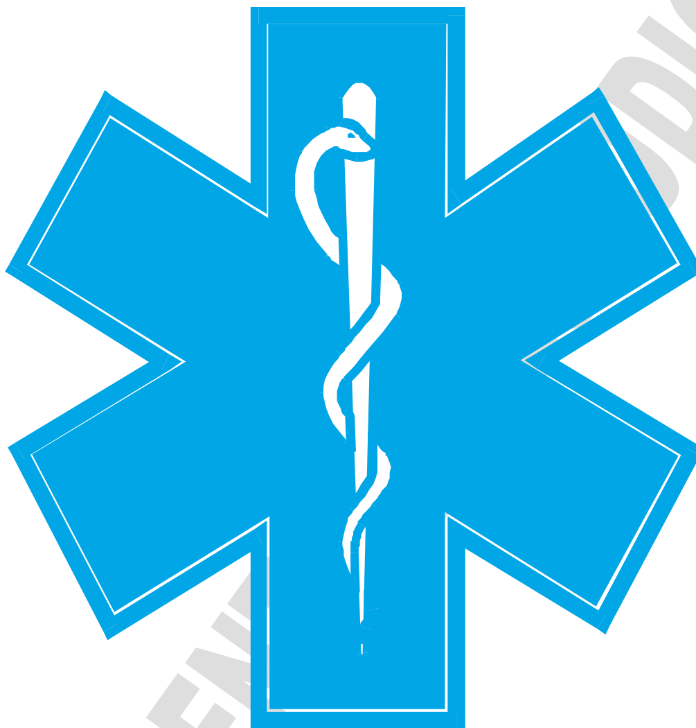
Figura A.1. Cruz de la vida (fondo verde o azul)